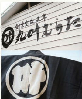
丸叶むらた創業宝永五年の歴史

れている。実はそうしたアイデアは男女問わず社内公募したが、採用されたのは女性スタッフのものばかりだった。多くのご家庭でお仏壇を管理し、お線香やろうそくを買いに行くのは女性の役割というケースが多いのだろう。女性目線で見れば、供養に用いるものも暗いイメージより、かわいい明るいイメージが好まれるはず。ところが、この業界はメーカーから卸、小売店まで、いまだに明るい色などは避ける傾向にある。派手にするのではなく、気持ちよく使っていただけの色や使いたくなる工夫などがこの業界には求められているのでは