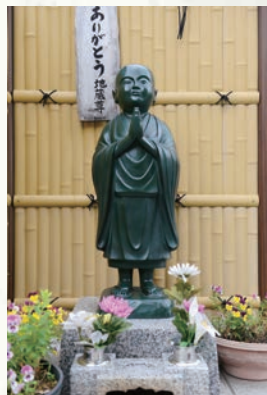
店頭で置かれた「ありがとう地蔵」お客様にも地域の方々にも、そして社員全員にも感謝の気持ちを持ち続ける象徴として設置しています。